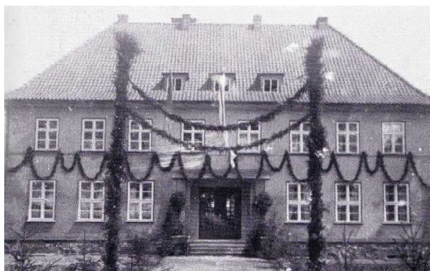
Церковный приход, 1925 г.